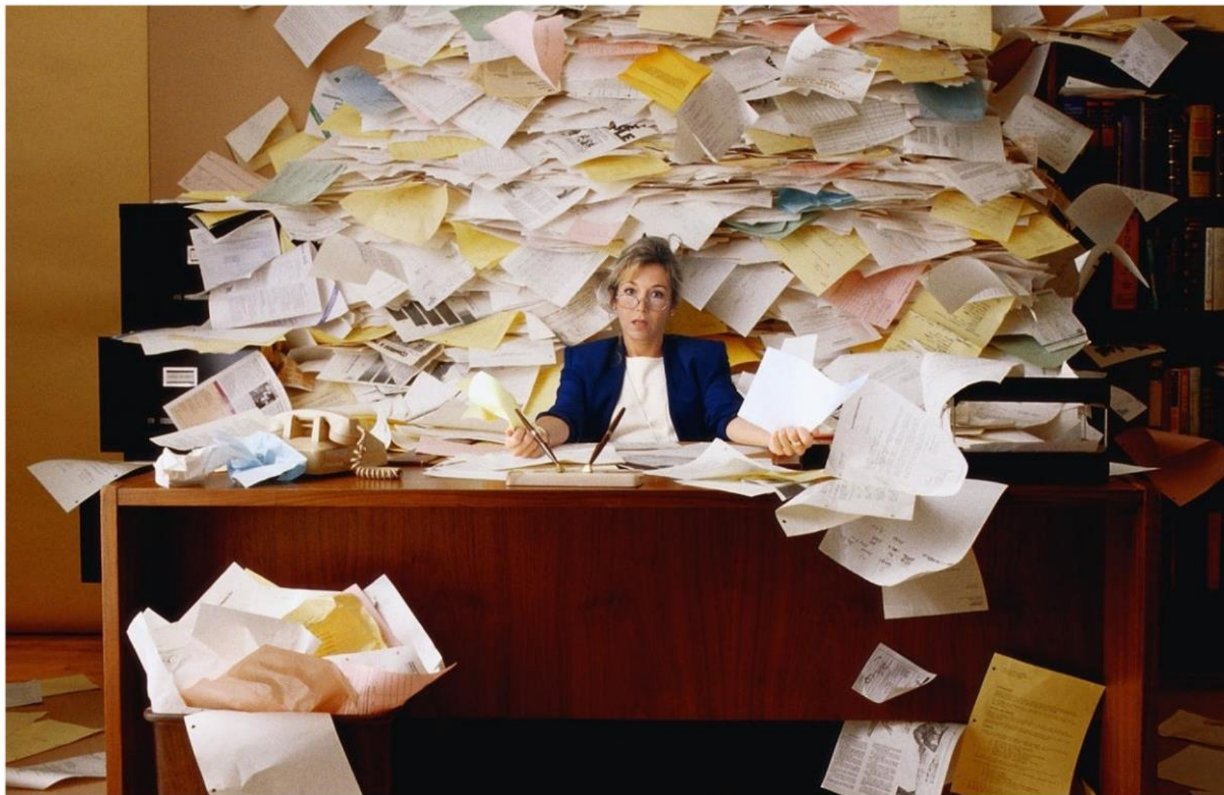
Unknown International Relations Officer, circa 2013